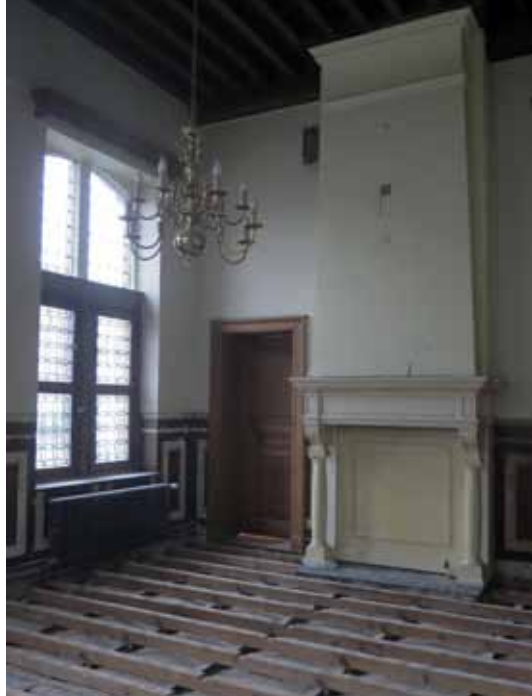
VU | Patricia De Somer, Grote Markt 1, 2000 Antwerpen | 201702

Op de bovenliggende verdiepingen, te bereiken via de monumentale toegangstrap, blijven De Trouwzaal, de Ontvangstzaal en de Raadszaal in gebruik. Op zolder komen een refter met kitchenette en een voorraad- en schoonmaakberging voor het personeel.