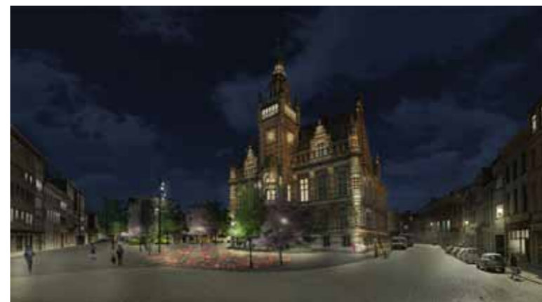
Impressie voorontwerp lichtontwerp Moorkensplein in het weekend.

In februari wordt het voetpad in de Langstraat recht gelegd met een normale boordsteen, zo kunnen auto's niet meer op het voetpad parkeren. In de Langstraat komt in het midden een buskussen om het doorgaande verkeer te vertragen en aan de Bakkerstraat een extra zebepad.