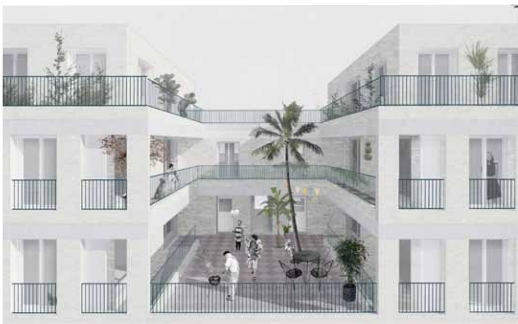
Wedstrijdbeeld – dakterrassen 1ste verdieping © Haerynck Vanmeirhaeghe architecten

Dit project kadert binnen het stedelijk grond- en pandenbeleid, waarbij AG VESPA leegstaande en verwaarloosde eigendommen aanpakt en als kwaliteitsvolle en duurzame woningen terug op de markt brengt.