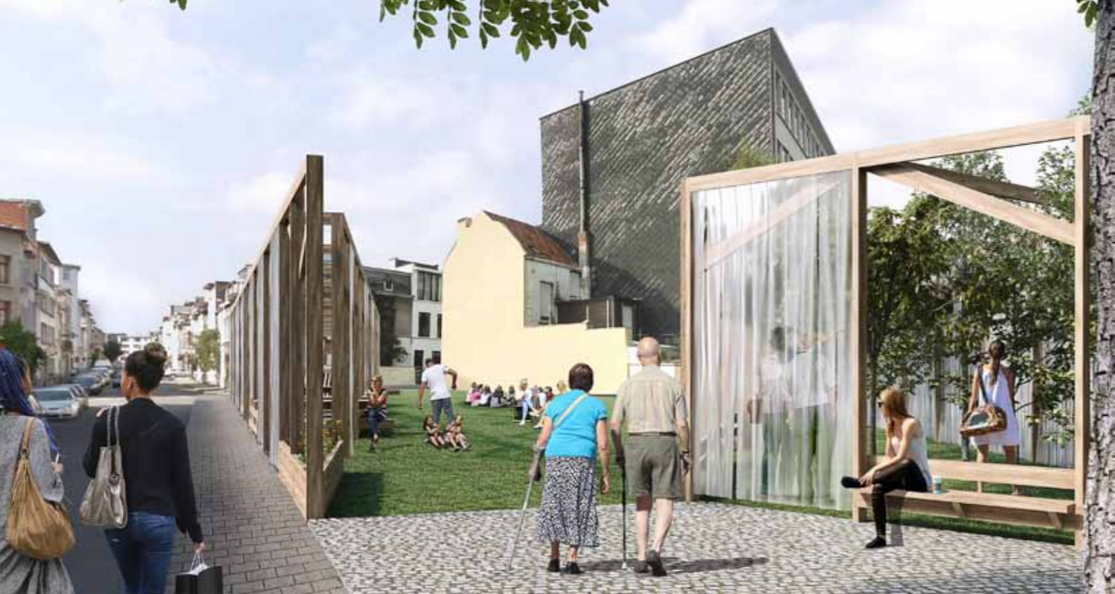
Impressie inrichting tijdelijke publieke ruimte aan de Langstraat. Zicht van onder onder de huidige boom.