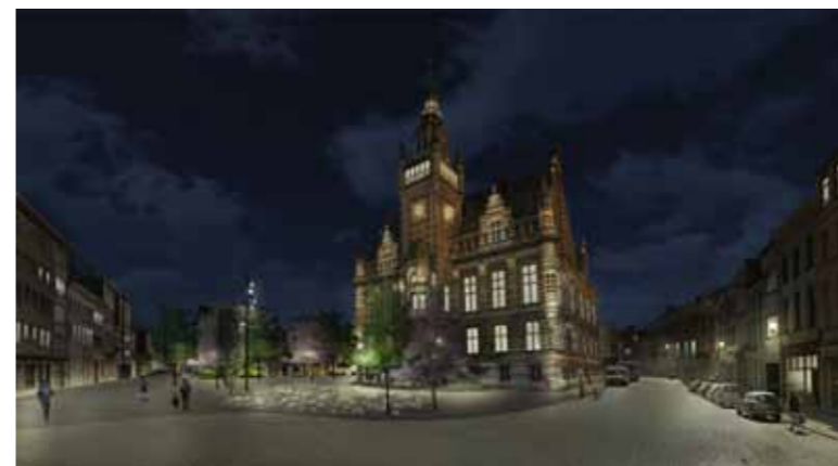
Impressie voorontwerp lichtontwerp Moorkensplein in de week.